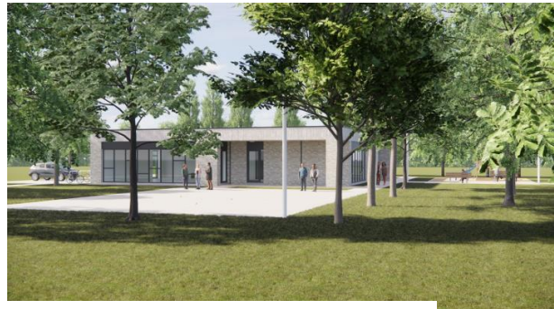
Bron: TRiAS architecten

Met de bouw van het antennepunt willen we dienstverlening naar Bouwel brengen, zodat minder mobiele inwoners gemakkelijker in contact kunnen komen met de medewerkers van onze gemeente. Je kan er ook terecht voor allerlei vragen, voor een babbel of een tasje koffie bij de krant.