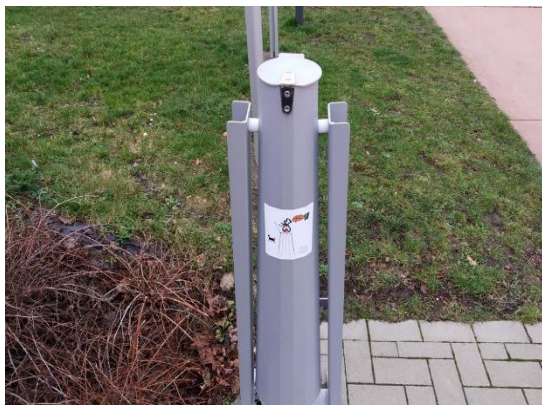
Zakjesdispenser voor hondenpoep